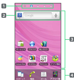
グリッドホーム画面（シート2（～10））