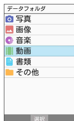
写真 → 写真などを確認 → 動画